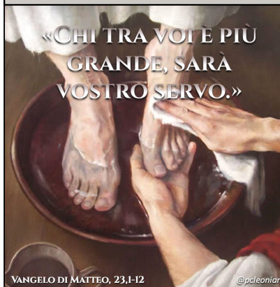
VANGELO DI MATTEO, 23,1-12