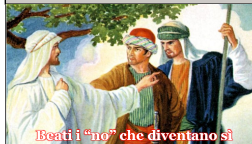
Beati i "no" che diventano sì

In quel tempo, Gesù disse ai capi dei sacerdoti e agli anziani del popolo: «Che ve ne pare? Un uomo aveva due figli. Si rivolse al primo e disse: "Figlio, oggi va' a lavorare nella vigna". Ed egli rispose: "Non ne ho voglia". Ma poi si pentì e vi andò. Si rivolse al secondo e disse lo stesso. Ed egli rispose: "Sì, signore". Ma non vi andò. Chi dei due ha compiuto la volontà del padre?». Risposero: «Il primo».