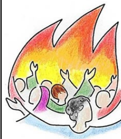
Sono venuto a gettare fuoco sulla terra

I n quel tempo, Gesù disse ai suoi discepoli: «Sono venuto a gettare fuoco sulla terra, e quanto vorrei che fosse già acceso! Ho un battesimo nel quale sarò battezzato, e come sono angosciato finché non sia compiuto! Pensate che io sia venuto a portare pace sulla terra? No, io vi dico, ma divisione. D'ora innanzi, se in una famiglia vi sono cinque persone, saranno divisi tre contro due e due contro tre; si divideranno padre contro figlio e figlio contro padre, madre contro figlia e figlia contro madre, suocera contro nuora e nuora contro suocera».