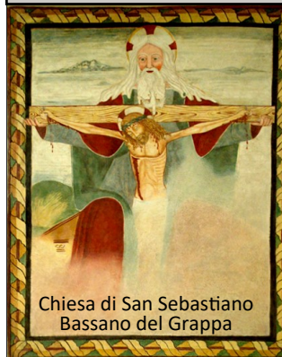
Chiesa di San Sebastiano Bassano del Grappa

I n quel tempo, disse Gesù ai suoi discepoli: «Molte cose ho ancora da dirvi, ma per il momento non siete capaci di portarne il peso. Quando verrà lui, lo Spirito della verità, vi guiderà a tutta la verità, perché non parlerà da se stesso, ma dirà tutto ciò che avrà udito e vi annuncerà le cose future. Egli mi glorificherà, perché prenderà da quel che è mio e ve lo annuncerà. Tutto quello che il Padre possiede è mio; per questo ho detto che prenderà da quel che è mio e ve lo annuncerà».