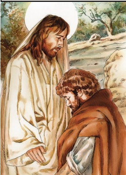
Tu sei il Cristo, il Figlio del Dio vivente

I n quel tempo, Gesù, giunto nella regione di Cesarèa di Filippo, domandò ai suoi discepoli: «La gente, chi dice che sia il Figlio dell'uomo?». Risposero: «Alcuni dicono Giovanni il Battista, altri Elia, altri Geremia o qualcuno dei profeti». Disse loro: «Ma voi, chi dite che io sia?». Rispose Simon Pietro: «Tu sei il Cristo, il Figlio del Dio vivente».