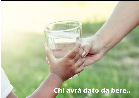
Chi avrà dato da bere..

I n quel tempo, Gesù disse ai suoi apostoli: «Chi ama padre o madre più di me non è degno di me; chi ama figlio o figlia più di me non è degno di me; chi non prende la propria croce e non mi segue, non è degno di me.