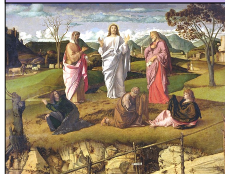
Giovanni Bellini, La Trasfigurazione, Napoli, Galleria Nazionale di Capodimonte.

I n quel tempo, Gesù prese con sé Pietro, Giovanni e Giacomo e salì sul monte a pregare. Mentre pregava, il suo volto cambiò d'aspetto e la sua veste divenne candida e sfolgorante. Ed ecco, due uomini conversavano con lui: erano Mosè ed Elia, apparsi nella gloria, e parlavano del suo esodo, che stava per compiersi a Gerusalemme.