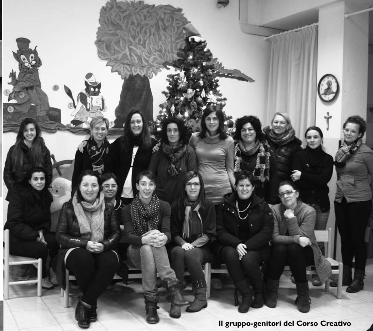
Il gruppo-genitori del Corso Creativo

sottofondi musicali natalizi. Anche i genitori sono impegnati a preparare il nostro Natale. A novembre si è svolto il Corso per i Mercatini. Un'esperienza, al suo secondo anno, gestita e organizzata dalle insegnanti, che vuole riunire mamme, papà, nonni e nonne, con lo scopo di conoscersi e di realizzare in modo originale e divertente oggetti natalizi, che si potranno visionare ed acquistare domenica 15 dicembre, giorno della Festa di Natale. Ecco alcuni oggetti realizzati.