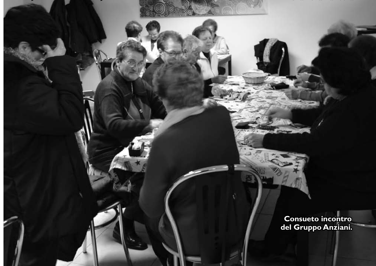
Consueto incontro del Gruppo Anziani.