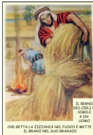
IL REGNO DEI CIELI È SIMILE A UN UOMO CHE GETTA LA ZIZZANIA NEL FUOCO E METTE IL GRANO NEL SUO GRANAILO

In quel tempo, Gesù espose alla folla un'altra parabola, dicendo: «Il regno dei cieli è simile a un uomo che ha seminato del buon seme nel suo campo. Ma, mentre tutti dormivano, venne il suo nemico, seminò della zizzania in mezzo al grano e se ne andò. Quando poi lo stelo crebbe e fece frutto, spuntò anche la zizzania. Allora i servi andarono dal padrone di casa e gli dissero: "Signore, non hai seminato del buon seme nel tuo campo? Da dove viene la zizzania?". Ed egli rispose loro: "Un nemico ha fatto questo!". E i servi gli dissero: "Vuoi che andiamo a raccogliarla?". "No, rispose, perché non succeda che, raccogliendo la zizzania, con essa sradichiate anche il grano. Lasciate che l'una e l'altro crescano insieme fino alla mietitura e al momento della mietitura dirò ai mietitori: Raccogliete prima la zizzania e legatela in fasci per bruciarla; il grano invece riponètelo nel mio granaio"».