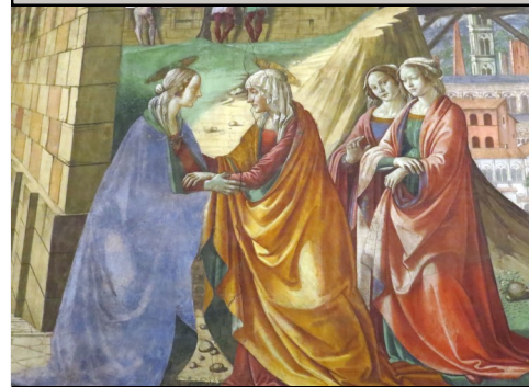
Firenze: Cappella Tornabuoni Visitazione del Ghirlandaio

I n quei giorni Maria si alzò e andò in fretta verso la regione montuosa, in una città di Giuda.