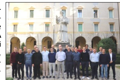
Foto dei Seminaristi 2023

Il titolo che accompagna la giornata del Seminario 2024 è un'espressione che si trova nella seconda lettura della liturgia del 6 ottobre, e riporta le parole di San Paolo nella Lettera agli Ebrei « A VANTAGGIO DI TUTTI » (Eb 2,9): a vantaggio di tutti è, infatti, la vocazione del prete in comunità, più che mai bisognose di riscoprire le relazioni fraterne, il dialogo, la condivisione della fede e la solidarietà.