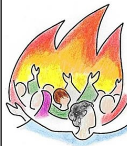
Sono venuto a gettare fuoco sulla terra

I n quel tempo, Gesù disse ai suoi discepoli: «Sono venuto a gettare fuoco sulla terra, e quanto vorrei che fosse già acceso! Ho un battesimo nel quale sarò battezzato, e come sono angosciato finché non sia compiuto! Pensate che io sia venuto a portare pace sulla terra? No, io vi dico, ma divisione. D'ora innanzi, se in una famiglia vi sono cinque persone, saranno divisi tre contro due e due contro tre; si divideranno padre contro figlio e figlio contro padre, madre contro figlia e figlia contro madre, suocera contro nuora e nuora contro suocera».