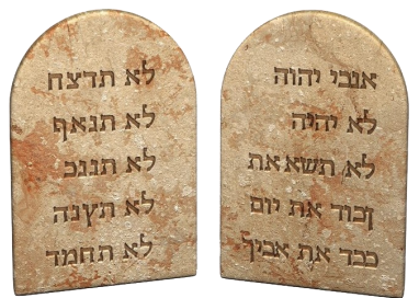
LE DIECI PAROLE

In quei giorni, Dio pronunciò tutte queste parole: «Io sono il Signore, tuo Dio, che ti ho fatto uscire dalla terra d'Egitto, dalla condizione servile: Non avrai altri dèi di fronte a me. Non pronuncerai invano il nome del Signore, tuo Dio, perché il Signore non lascia impunito chi pronuncia il suo nome invano. Ricòrdati del giorno del sabato per santificarlo. Onora tuo padre e tua madre, perché si prolunghi- no i tuoi giorni nel paese che il Signore, tuo Dio, ti dà. Non ucciderai. Non commetterai adulterio. Non ruberai. Non pronuncerai falsa testimonianza contro il tuo prossimo. Non desidererai la casa del tuo prossimo, né il suo schiavo né la sua schiava, né il suo bue né il suo asino, né alcuna cosa che appartenga al tuo prossimo».