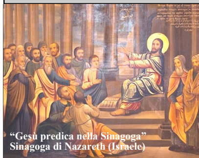
“Gesù predica nella Sinagoga” Sinagoga di Nazareth (Israele)

Poiché molti hanno cercato di raccontare con ordine gli avvenimenti che si sono compiuti in mezzo a noi, come ce li hanno trasmessi coloro che ne furono testimoni oculari fin da principio e divennero ministri della Parola, così anch'io ho deciso di fare ricerche accurate su ogni circostanza, fin dagli inizi, e di scrivere un resoconto ordinato per te, illustre Teòfilo, in modo che tu possa renderti conto della solidità degli insegnamenti che hai ricevuto. In quel tempo, Gesù ritornò in Galilea con la potenza dello Spirito e la sua fama si diffuse in tutta la regione. Insegnava nelle loro sinagoghe e gli rendevano lode. Venne a Nazaret, dove era cresciuto, e secondo il suo solito, di sabato, entrò nella sinagoga e si alzò a leggere. Gli fu dato il rotolo del profeta Isaia; aprì il rotolo e trovò il passo dove era scritto: «Lo Spirito del Signore è sopra di me; per questo mi ha consacrato con l'unzione e mi ha mandato a portare ai poveri il lieto annuncio, a proclamare ai prigionieri la liberazione e ai ciechi la vista; a rimettere in libertà gli oppressi e proclamare l'anno di grazia del Signore». Riavvolse il rotolo, lo riconsegnò all'inserviente e sedette. Nella sinagoga, gli occhi di tutti erano fissi su di lui. Allora cominciò a dire loro: «Oggi si è compiuta questa Scrittura che voi avete ascoltato».