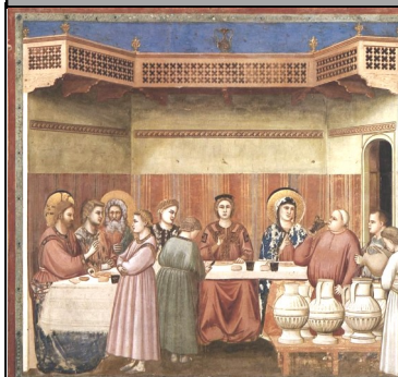
Nozze di Cana Cappella degli Scrovegni - Padova

In quel tempo, vi fu una festa di nozze a Cana di Galilea e c'era la madre di Gesù. Fu invitato alle nozze anche Gesù con i suoi discepoli.