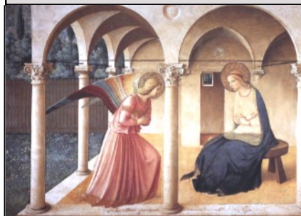
Beato Angelico, Annunciazione , 1440 ca. Affresco, 2,30 x 3,21 m. Firenze, Convento di San Marco, corridoio nord delle celle.

I n quel tempo, l'angelo Gabriele fu mandato da Dio in una città della Galilea, chiamata Nàzaret, a una vergine, promessa sposa di un uomo della casa di Davide, di nome Giuseppe. La vergine si chiamava Maria. Entrando da lei, disse: «Rallègrati, piena di grazia: il Signore è con te».